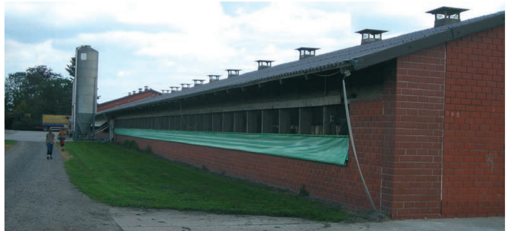
Der Putenstall bietet Platz für 3000 Puten.

Eine Kälteleistung von 70 kW, das Blockheizkraftwerk (BHKW) mit 350 kW und ein Kältespeicher von 8000 l Wasser – das sind die technischen Eckdaten der thermischen Kühlanlage in einem Putenmastbetrieb im niedersächsischen Varrel. Im Rahmen des Forschungsprojektes „nordwest2050-Perspektiven für klimaangepasste Innovationsprozesse in der Metropolregion Bremen-Oldenburg im Nordwesten“* wurde jetzt erstmalig in der Masttierzucht in Deutschland ein thermisch angetriebenes Kühlungssystem eingesetzt.